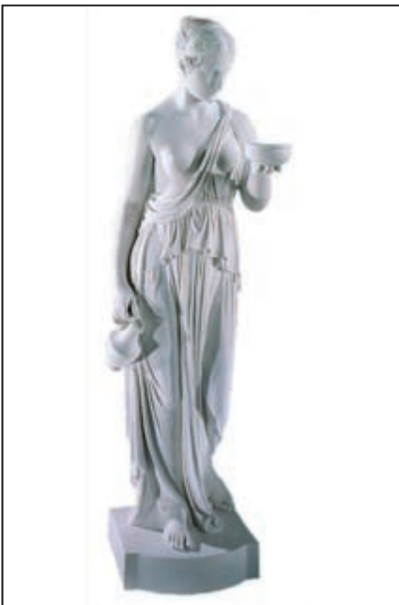
EBE Hauteur 1.20 m