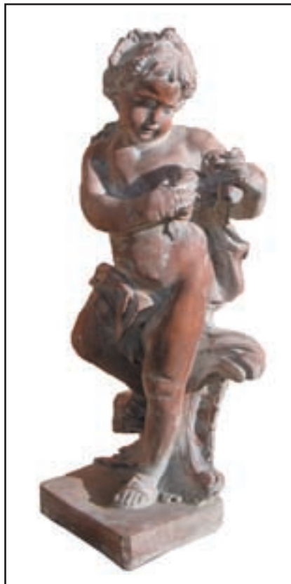
ETE réf. SAE Haut. 80 cm - base 25x25 cm