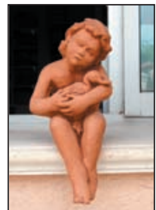
GARCON AU CANARD réf. SGAC Haut. 36cm - Larg.16cm