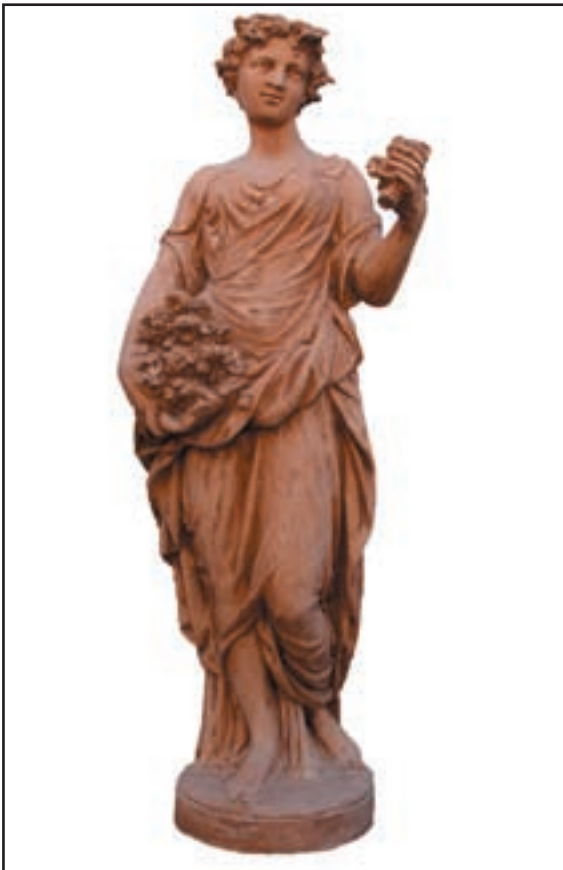
PRINTEMPS réf. STP Haut. 1.60 m - diam. 38 cm