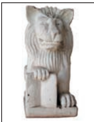
LION PRESSE LIVRE réf. SLL Haut. 20cm - Base 9x9 cm