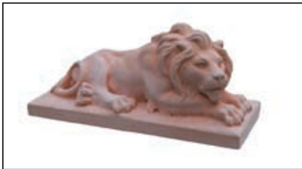
LION COUCHE réf. STLC1 Haut. 12 cm - Base 28x11 cm