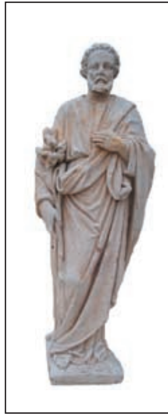
ST JOSEPH réf. STSJ Haut. 57cm