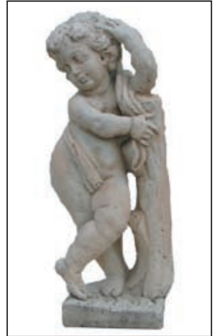
ANGELOT HIVER réf. SAHPM Haut. 62 cm - base 20x20 cm