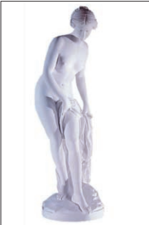
VENUS DE FALCONET Hauteur 1.20 m