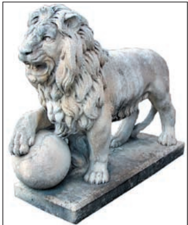
LEO réf. LBO Haut. 68 cm - base 75 x 29 cm