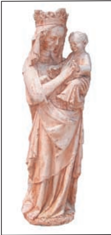
VIERGE A L'ENFANT réf. STV01 Haut. 70 cm - diam. 20 cm