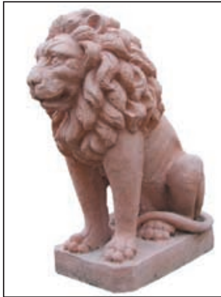
LION ASSIS réf. SLA Haut. 56 cm - base 38x22 cm