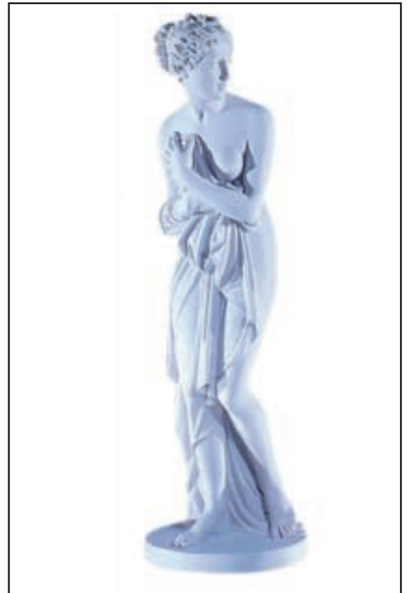
VENUS DE CANOVA Hauteur 1.20 m