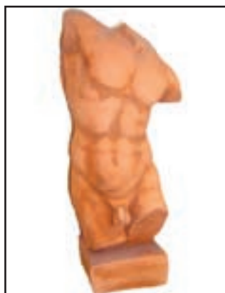
APOLLON réf. SAP Haut. 40cm - Base 12x12 cm