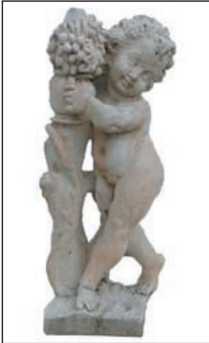
ANGELOT AUTOMNE réf. SAA Haut. 62 cm - base 20x20 cm