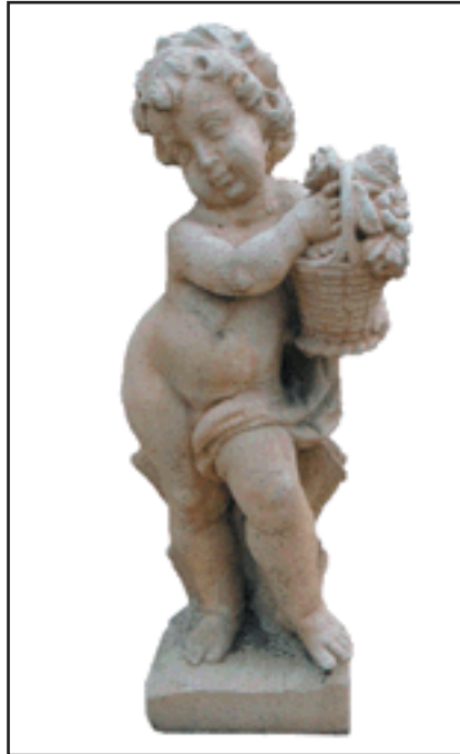
ANGELOT PRINTEMPS réf. SAP Haut. 62 cm - base 20x20 cm