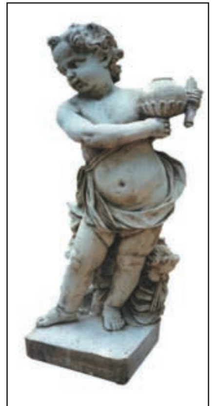
HIVER réf. SAH Haut. 80 cm - base 25x25 cm