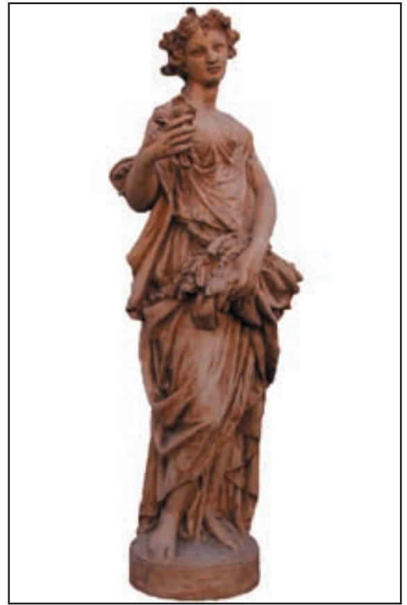
ETE réf. STE Haut. 1.60 m - diam. 38 cm