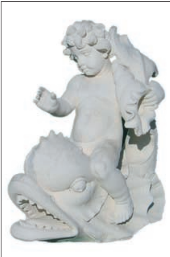
ANGELOT AU DAUPHIN réf. SAD Haut. 90 cm - base 90 x 35 cm