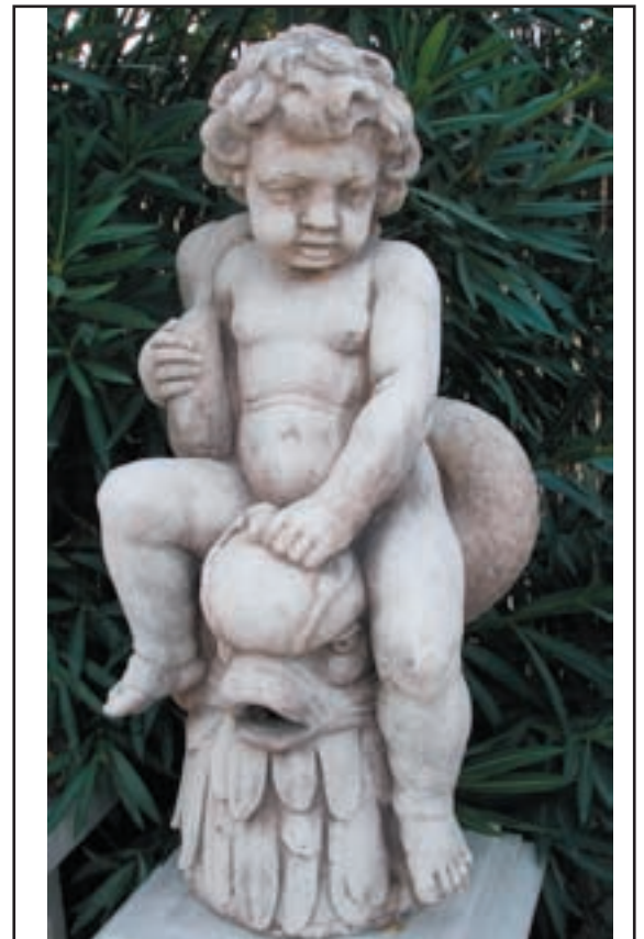
NEMEE réf. SFN Haut. 80 cm - diam. 25 cm