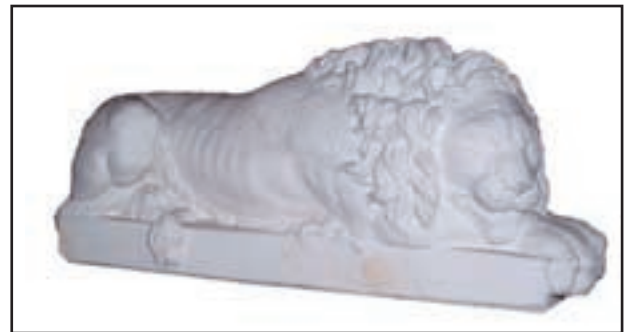
LION COUCHE réf. STLC2 Haut. 14 cm - Base 31x10 cm