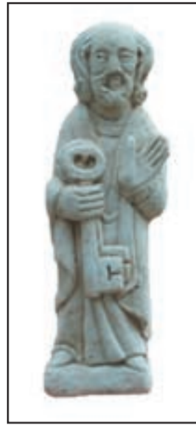
ST PIERRE réf. SSP Haut. 30 cm Base 10x10cm