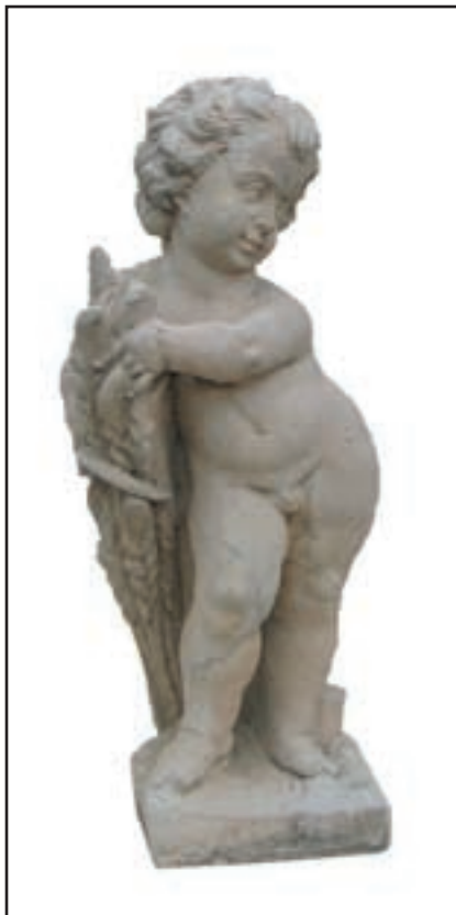
ANGELOT ETE réf. SAEPM Haut. 62 cm - base 20x20 cm