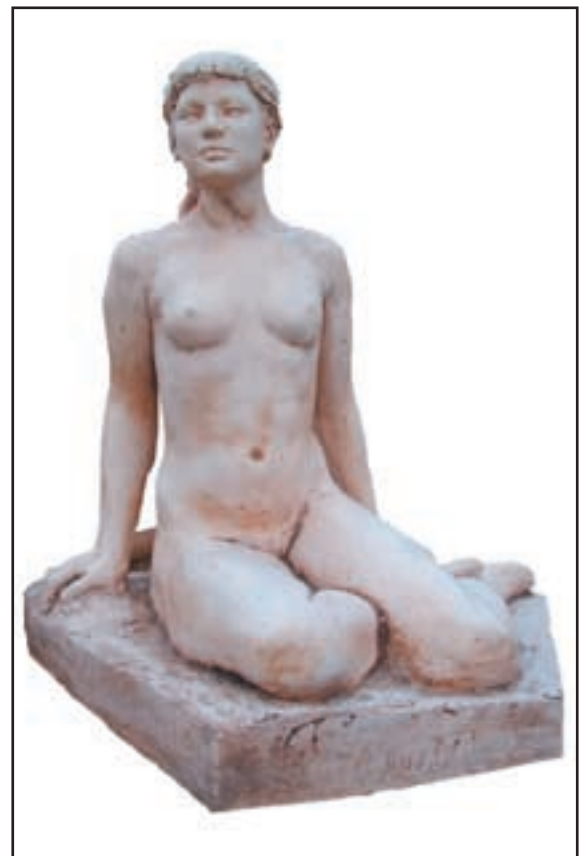
FEMME ASSISE Hauteur 1 m - Base : Larg.98 cm Prof.65 cm