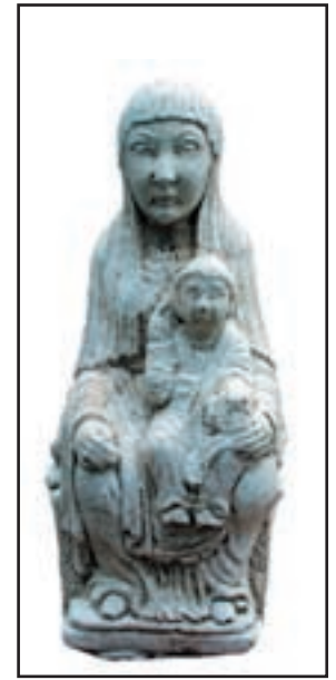
VIERGE ROMANE réf. SVR Haut. 28 cm Base 7x7 cm